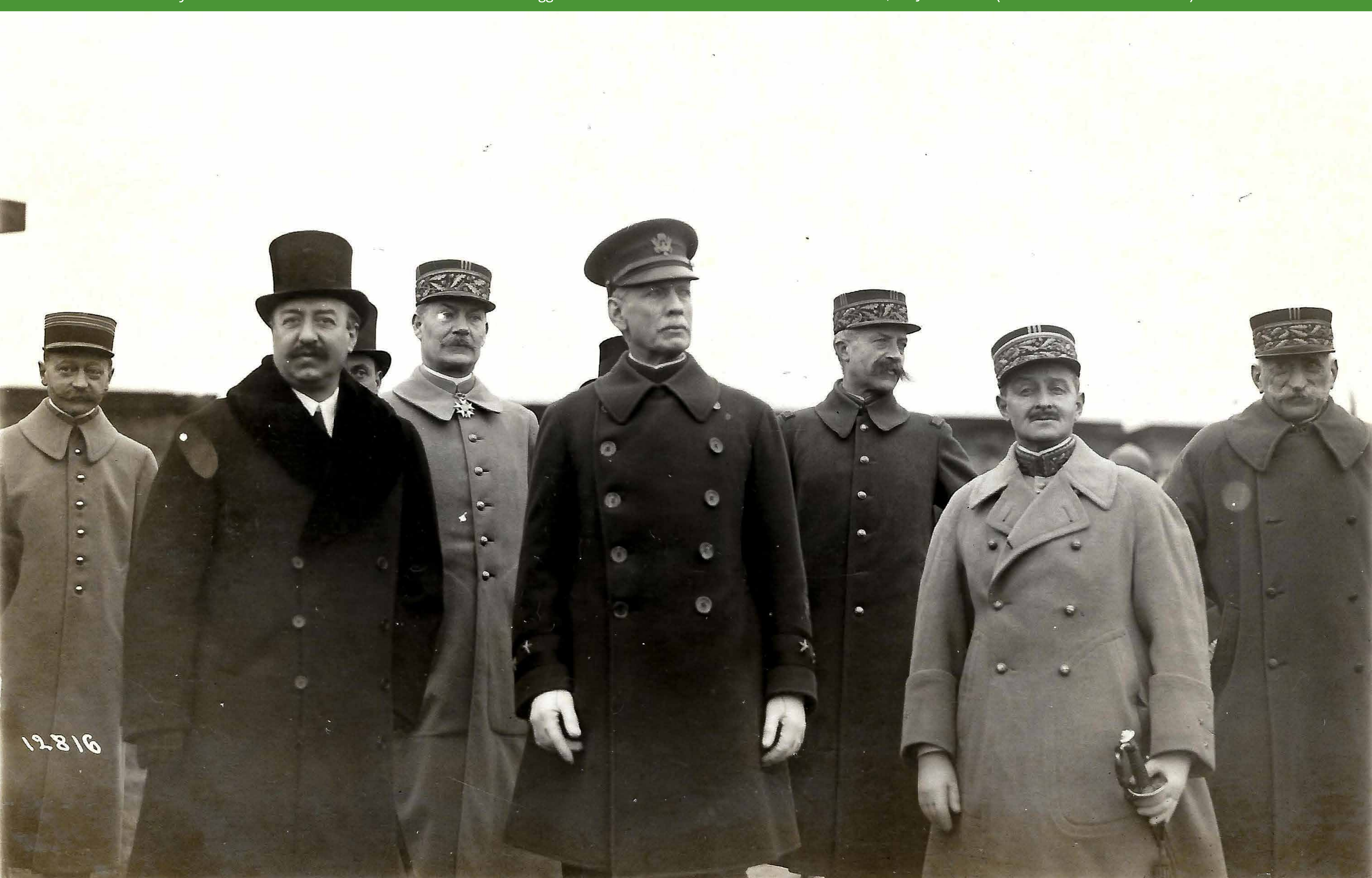
General Henry T. Allen und IRKO-Präsident Paul Tirard während der Flaggenwechsel-Zeremonie auf der Feste Ehrenbreitensein, 24. Januar 1923

Im gleichen Sinne äußerte sich General Allen optimistisch, dass der gute Wille der Besatzungsmächte von der deutschen Seite gewürdigt werde: „Ich bin zuversichtlich, dass dieser Geist von Gerechtigkeit und Fairness, dem unsere Alliierten Beifall spenden, in zukünftigen Tagen jegliches Gefühl von Bitterkeit oder Groll uns gegenüber in den Herzen derjenigen, unter denen wir gelebt haben, verhindern und dazu beitragen wird, wahren Frieden zu erreichen.“ (Übersetzt nach: My Rhineland Journal, Boston 1923, S. 537)