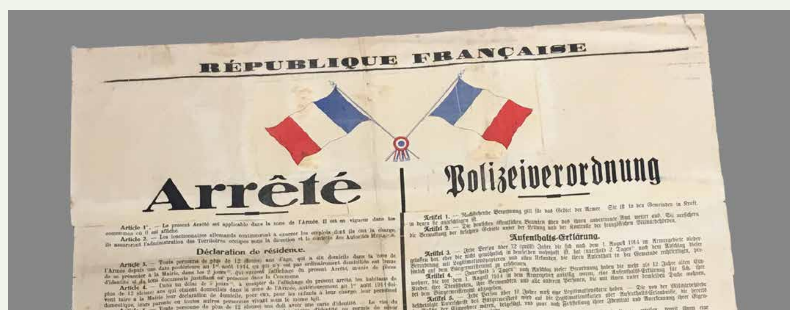
Französische Anordnung, Ende 1918 (Stadtarchiv Kaiserslautern, P-A1-1076_a)

Ab dem 15. Dezember 1918 wurden die Uhren um eine Stunde zurückgestellt („französische Zeit“). Zudem griffen Ausgangssperren massiv in den Tagesablauf ein. Zwischen 8 Uhr abends und 6 Uhr morgens durfte sich anfangs niemand außer Haus aufhalten. Auch räumlich wurde die Mobilität zunächst eingeschränkt. Begrenzungen galten auch für die Rheinbrücken bei Koblenz, Mainz und Ludwigshafen sowie für Post und Telefon. Im Juni 1919 wurde die Grenzblockade aufgehoben. In den folgenden Jahren wurde aber die Bewegungsfreiheit immer wieder eingeschränkt. Trotz dieser Belastungen zeigen Tagebücher und ähnliche Dokumente, dass sich das Zusammenleben konfliktfrei gestaltete, als die deutsche Propaganda behauptete. So sahen selbst nationalistisch Denkende ein, dass auch die französische Bevölkerung unter den Folgen des Krieges litt.