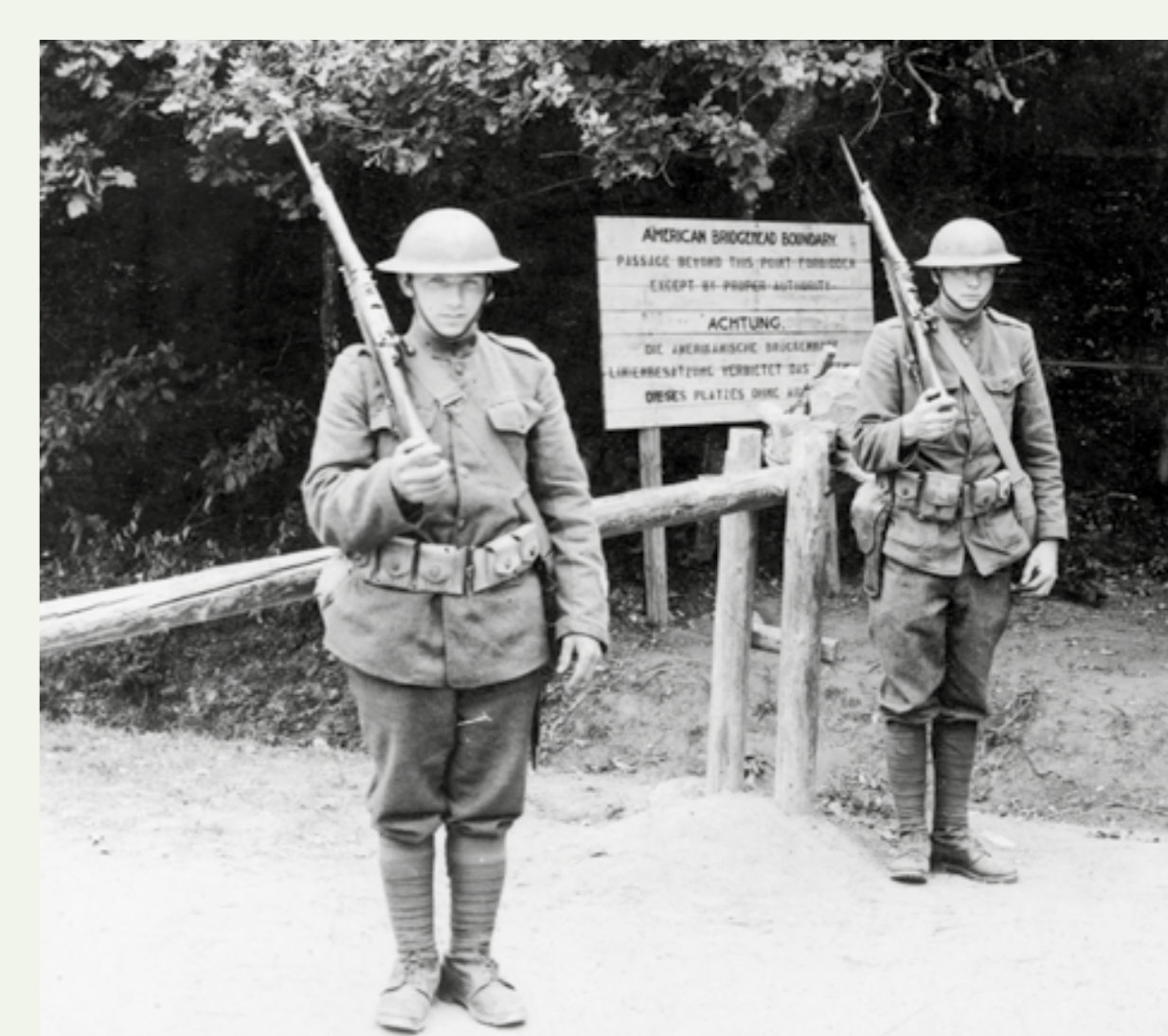
Bewachung des amerikanischen Brückenkopfes in Montabaur, 1919

Der Wohlstand der USA und die deutschen Wurzeln vieler Amerikaner bedingten, dass das deutsch-amerikanische Verhältnis von vorneherein weniger belastet war. Doch auch die amerikanische Besatzungsmacht erließ zunächst strikte Maßnahmen wie Versammlungsverbot, Pressezensur und eine abendliche Ausgangssperre. Zudem war der private Umgang mit der deutschen Bevölkerung verboten. Bei einer Einquartierung in Privathaushalten war dies jedoch nicht umsetzbar. Das Verbot wurde im Sommer 1919 aufgehoben.