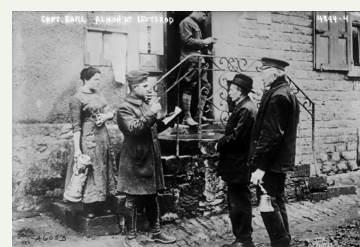
Tagesbefehl der Amerikaner in Wirges, 1919