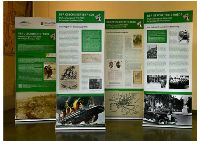
Die Wanderausstellung besteht aus insgesamt 20 RollUps.