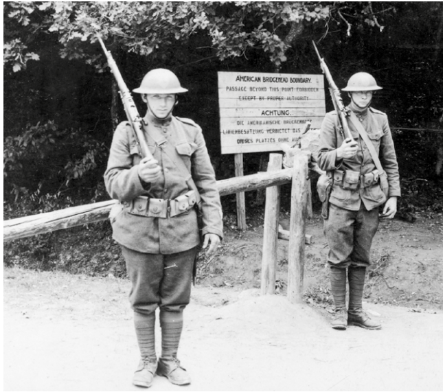
Bewachung des amerikanischen Brückenkopfes in Montabaur

Die französische und amerikanische Besetzung der Jahre 1918–1930 im Gebiet von Rheinland-Pfalz erscheint als eine von Not und Härte geprägte Zeit. Während damals die Wahrnehmung auf beiden Seiten von Vorurteilen und nationalistischer Agitation bestimmt war, spiegeln persönliche Zeugnisse ganz andere Erfahrungen wider. So gab es im zwischenmenschlichen Bereich durchaus Ansätze für Verständigung und Versöhnung. Die Wanderausstellung „Der gescheiterte Friede“, der gleichnamige Katalog und die regional ergänzende Website „ https://1914-1930-rlp.de “ möchten beides zeigen – die vielfältigen Belastungen, unter denen Deutschland wie auch Frankreich nach dem furchtbaren Weltkrieg litten, aber auch die versöhnlichen Entwicklungen, selbst wenn ein dauerhafter Friede erst nach 1945 realisiert werden konnte.